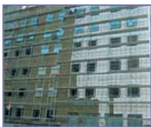
Рисунок 1. (подробнее) Реконструируемое здание в Москве с монтируемым фасадом с алюминиевой подконструкцией

конструкции равным \gamma = 0,85–0,90 , после чего рассчитывают необходимую толщину слоя минераловатной теплоизоляции, которая получается равной 0,10–0,15 м. Такой прием является типичным и имеет место при проектировании многих объектов.