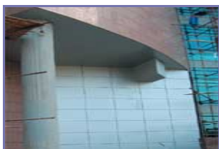
Рисунок 9. (подробнее)

В таких случаях влага, попадающая в воздушный зазор из помещений вследствие влагопереноса через стену и слой теплоизоляции, почти не выходит в наружный воздух, скапливаясь в зазоре и увлажняя теплоизоляцию. Вследствие этого снижается долговечность минераловатного утеплителя и его теплозащитные свойства.