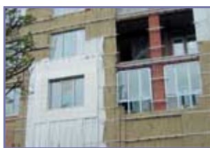
Рисунок 6. (подробнее) Гидроветрозащитная пленка расположена поверх горизонтальных направляющих

Закрепление пленки не по поверхности утеплителя, а на расстоянии от него вызывает ее колебания, что, с одной стороны, может сопровождаться звуковыми эффектами, а с другой стороны, понижает ее долговечность.