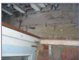
Рисунок 3. (подробнее) Отсутствие воздушного зазора (вид сверху через раскрытое окно)

Расположение направляющих в слое теплоизоляции (рис. 4), с точки зрения строительной теплофизики, невыгодно тем, что снижает коэффициент теплотехнической однородности.