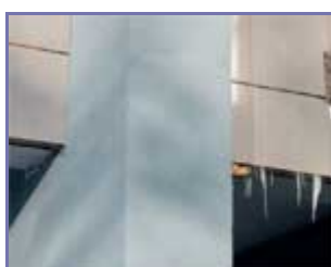
Рисунок 7. (подробнее) Отсутствие воздушного зазора и влагоперенос через стену привели к скоплению влаги в утеплителе

Отсутствие воздушного зазора или недостаточная его ширина при некоторых условиях может вызвать скопление влаги и переувлажнение утеплителя (рис. 7). Таким образом, представляется целесообразным установить требования к ограничению кривизны стены, на которой предполагается монтаж вентилируемого фасада. Проектирование фасада нужно осуществлять с учетом фактической кривизны поверхности стены так, чтобы соблюдалась ширина воздушного зазора, определенная из условия влагоудаления.