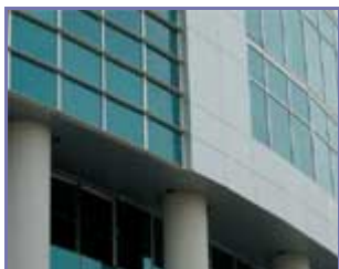
Рисунок 8. (подробнее)

Встречаются также решения фасадов, в которых вход в воздушный зазор предусмотрен, но вентиляция в нем затруднена из-за большого сопротивления движению воздуха.