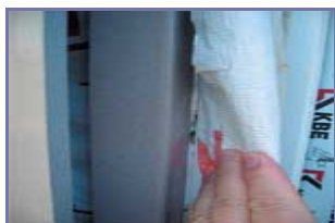
Рисунок 11. (подробнее) Установка оконного блока с обрамлением по откосу стальным профилем с последующим его утеплением

На рисунке 10 показана грубая и очевидная ошибка, допущенная проектировщиком при проектировании этих узлов. Менее очевидная ошибка представлена на рисунке 11, где показано обрамление оконных откосов утепленным стальным профилем. Если для конструкции на рисунке 10 грозит промерзание, то для конструкции на рисунке 11 — повышенные теплопотери. Ни в том, ни в другом случае теплотехнические расчеты узлов не проводились.