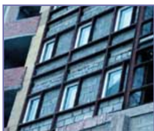
Рисунок 10. (подробнее) Стена здания, подготовленная для монтажа вентилируемого фасада. Оконные проемы «обрамлены» стальными швеллерами

При проектировании узлов примыкания оконных блоков к стене с вентилируемым фасадом основные ошибки заключаются в установке по контуру оконных блоков металлических элементов, которые являются мощными теплопроводными включениями. Необходимо проводить расчеты температурных полей, анализ которых поможет избежать дополнительных теплопотерь и промерзания элементов блоков и оконных откосов.