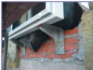
Рисунок 2. (подробнее) Опирание витража

Таким образом, в рассматриваемом примере решения, принятые на стадии проектирования, не обеспечивают теплозащиты, требуемой вторым этапом «энергосбережения» [1].